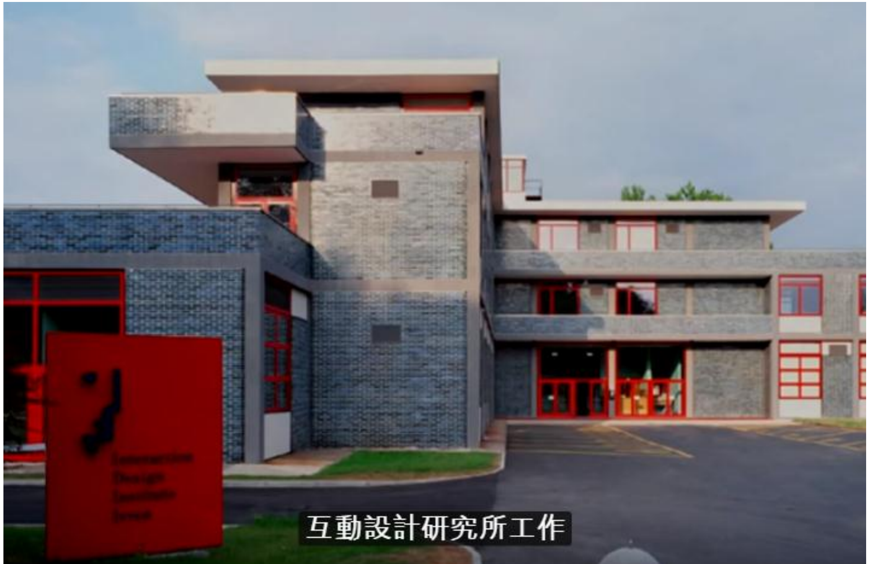
互動設計研究所工作