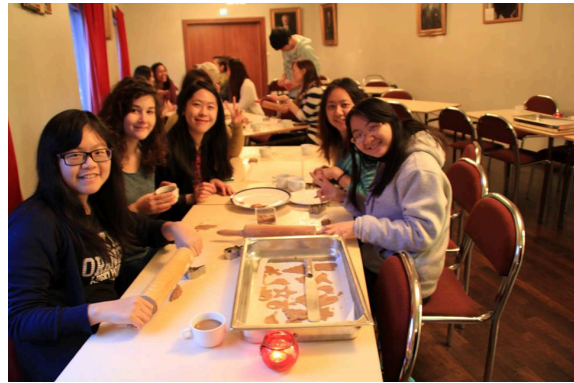
跟大家一起做 Ginger bread,是聖誕節很重要的點心之一！