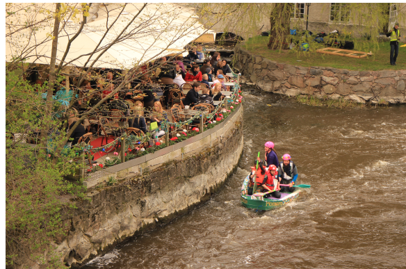
Uppsala 一年一度的 Vlaborg 漂流節！參加的隊伍需要自製一艘船，4/30 在 Fyrisån 這一天比賽。