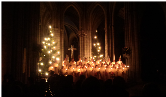
Saint Lucia concert at Domkyrka.