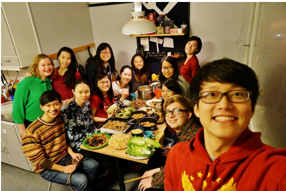
台灣同學及邀請外國朋友一起吃年夜飯！