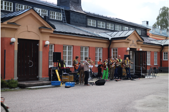
剛開學時有大大小小的活動，一個樂隊在我們其中一棟系館前演出。